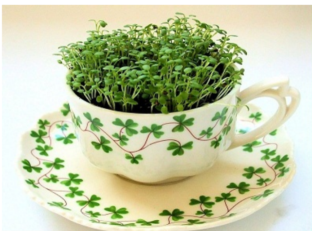
یک مطلب تازه از طلوع مهر

۳/ آنچه در فقه شیعی تعریف و تشریح شده است، با مکانیسم تمایل جنسی کاملاً سازگار است. اما فرهنگ بدعت آلود ایرانی که ازدواج موقت و صیغه کردن و صیغه شدن را مذمت و مسخره میکند، نه فقط با مکانیسم سرکش غریزه جنسی سازگار نیست بلکه مشتمل بر رویکردی ابلهانه، بدعت آلود بوده و دهن کجی به حکم خدا است و باید گفت شیطان در این زمینه خیلی موفق بوده است.